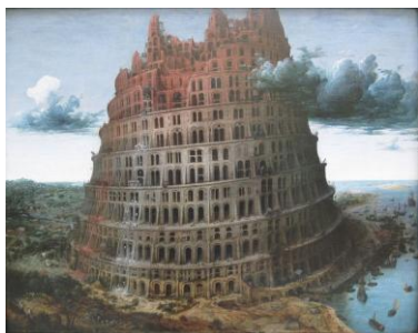
Pieter Breughel de Oude De toren van Babel, ca 1556