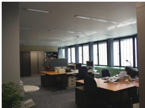
Afgevaardigden van de Vicariaten overleggen voortaan geregeld met de administratief-juridische cel van het VVKBaO in de ‘Guimardstraat’