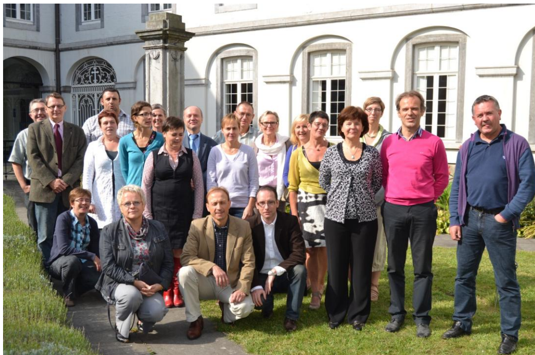
De ploeg van de pedagogische begeleiding basisonderwijs, de godsdienstinspectie en van het Vicariaat onderwijs

De hele reorganisatie moet ertoe bijdragen dat de dienstverlening vanuit het Vicariaat Onderwijs alle terreinen beslaat waar schoolbesturen en directeurs mee te maken krijgen, zowel het pedagogisch-didactische, als het terrein van de identiteit en de schoolpastoraal en alle andere verplichtingen van niet-pedagogische aard die op scholen afkomen vanuit administratief-juridische en welzijnshoek.