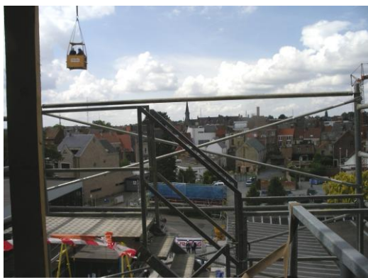
Bouwwerf nieuwe infrastructuur Heilig-Hart & College Halle

Het Departement Onderwijs schreef in de loop van het schooljaar 2010-2011 een brief aan de burgemeesters van zeven gemeenten waarin het conclusies formuleerde op basis van 'sleuteldata' die de gemeenten hadden aangeleverd in verband met de demografische evolutie in de voorbije vijf schooljaren, de evolutie van het aantal kleuters en het aantal weigeringen en vrije plaatsen in het voorafgaande schooljaar. Waar zich een sterke stijging had voorgedaan stelde de Minister van Onderwijs voor om structureel een lokale taskforce bijeen te roepen om de problematiek verder te onderzoeken en voorstellen tot capaciteitsuitbreiding te verzamelen bij alle onderwijsnetten. De regierol werd bij de gemeenten gelegd.